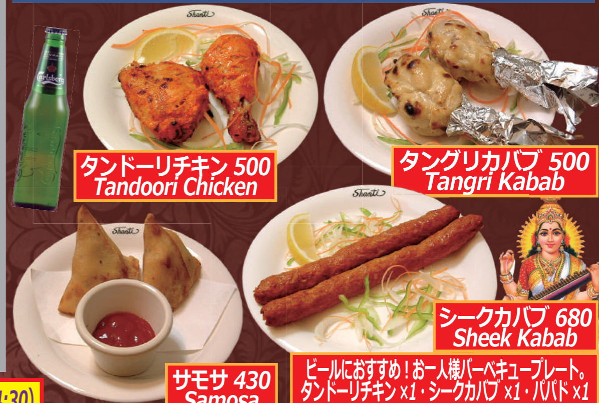
タンドーリチキン 500 Tandoori Chicken