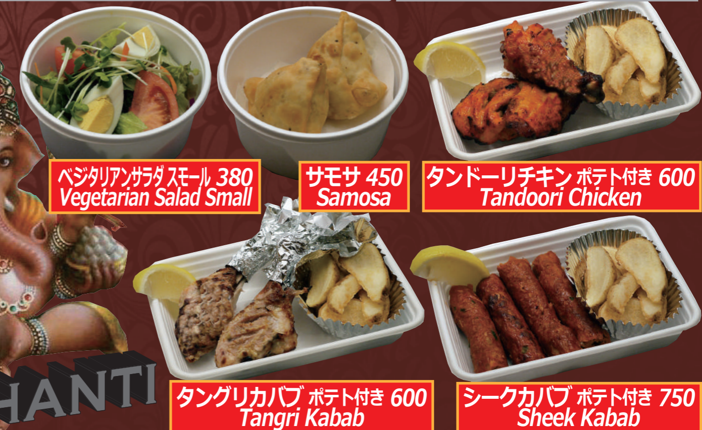
ベジタリアンサラダスモール 380 Vegetarian Salad Small