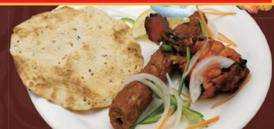
シングルタンドーリプレート 650 Single Tandoori Plate

ビールにおすすめ! お一人様バーベキュープレート。 タンドーリチキン x1・シークカバブ x1・パパド x1