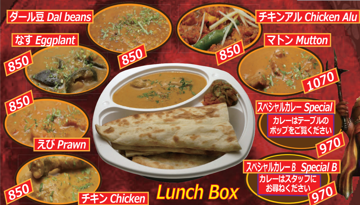
ダール豆 Dal beans

カレーランチのテイクアウト! カレーとナン (またはライス) のセット 出来たての本格インドカレーをオフィスやご自宅でお召し上がりください。 カレーと裏面最下部から STEP 2 辛さ STEP 3 パン・ライス をお選びください。 Take out of Curry Lunch. Please choose a curry and bread or rice.